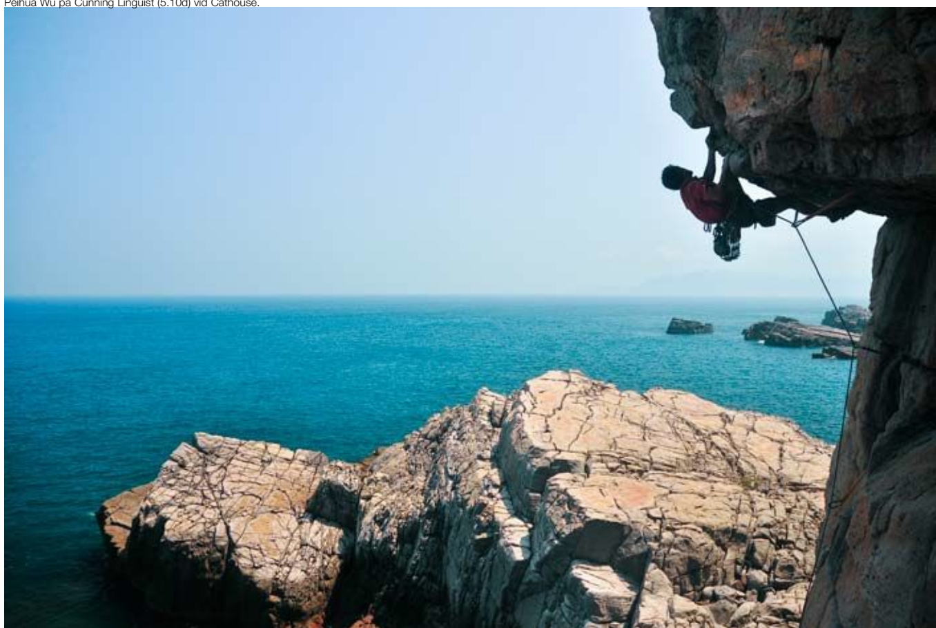
Stephen Parr i luftig position på Black Hole (5.11a) vid Long Lane.