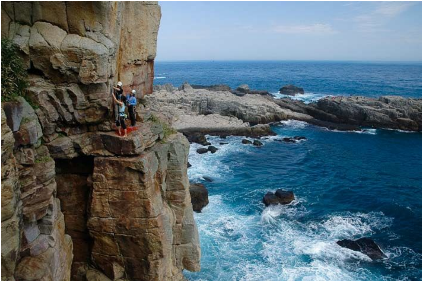
Standplats med havsutsikt.